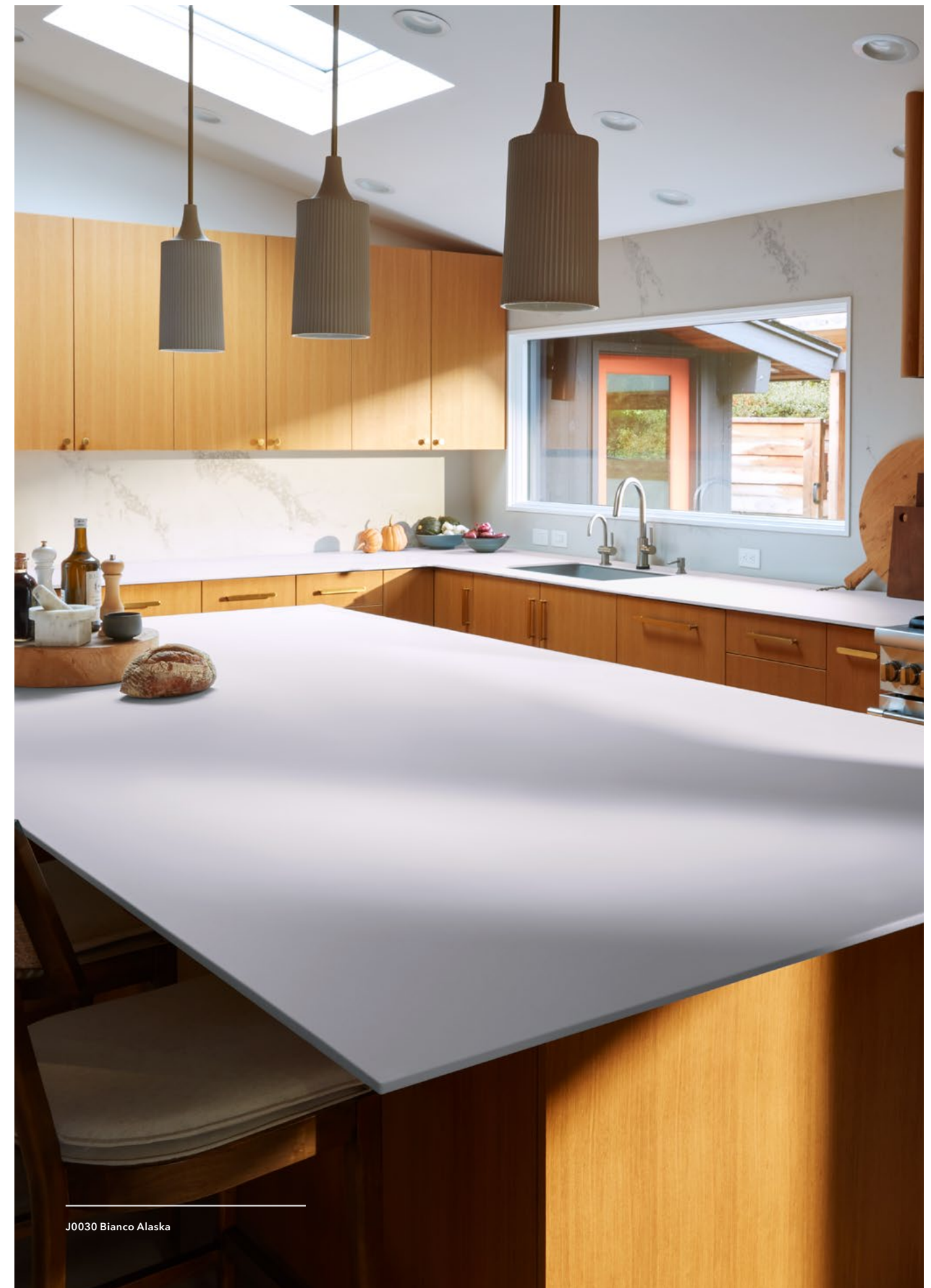
J0030 Bianco Alaska

Protective film included. FENIX NTM can be machined with standard carpenters tools. Película protectora incluida. FENIX NTM se puede trabajar fácilmente con herramientas de carpintería comunes. Pellicule de protection comprise. FENIX NTM peut être retravaillé avec les outils traditionnels du menuisier.