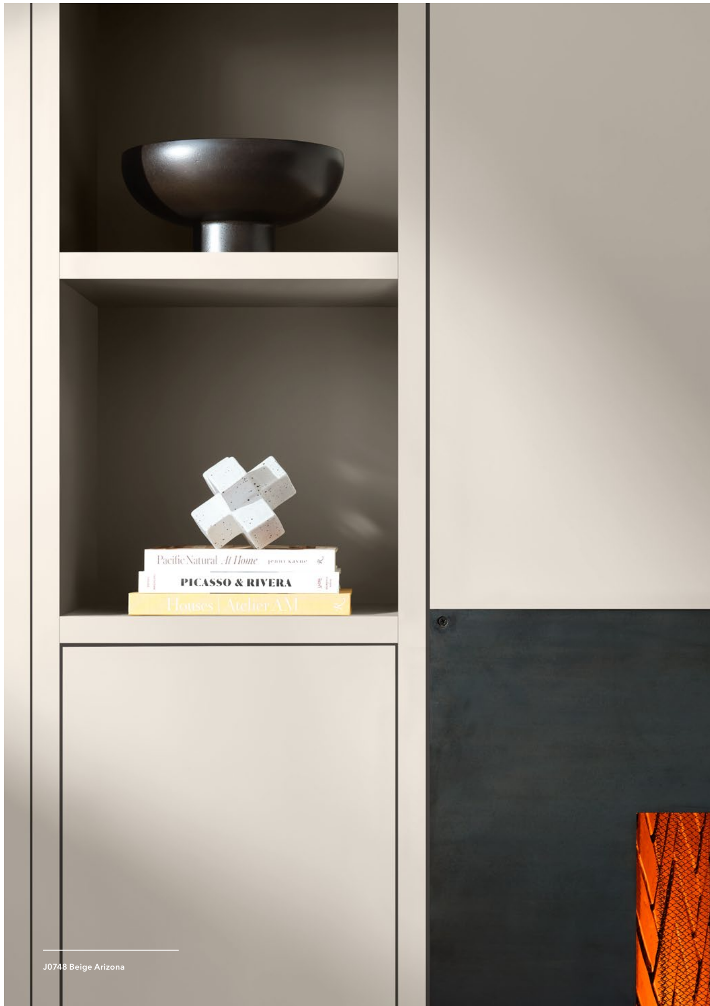
J0748 Beige Arizona