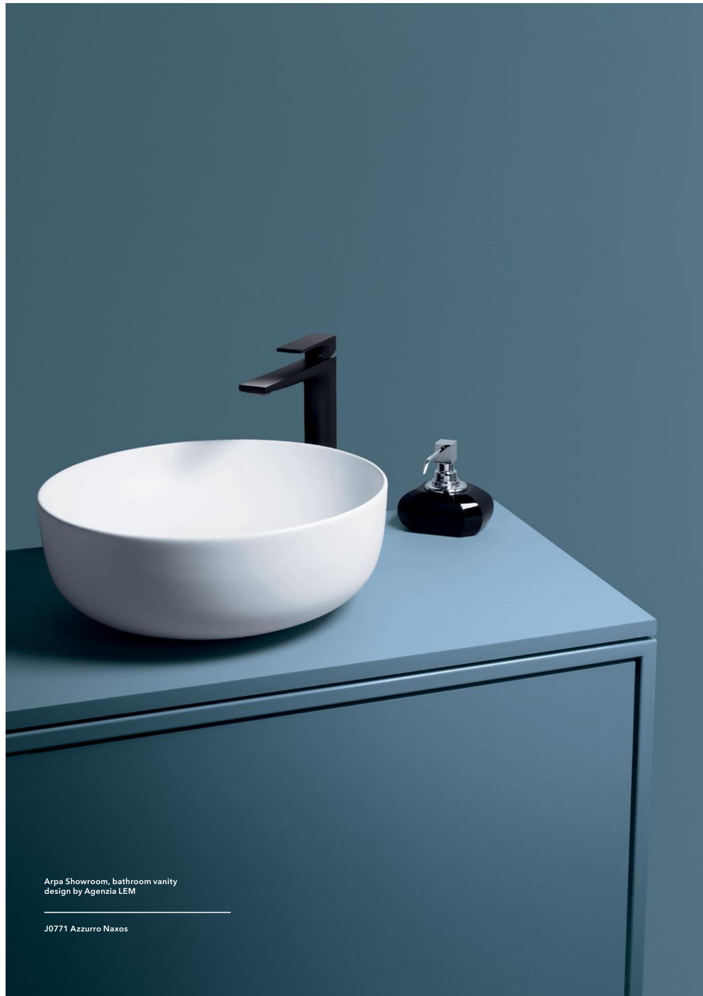
Arpa Showroom, bathroom vanity design by Agenzia LEM